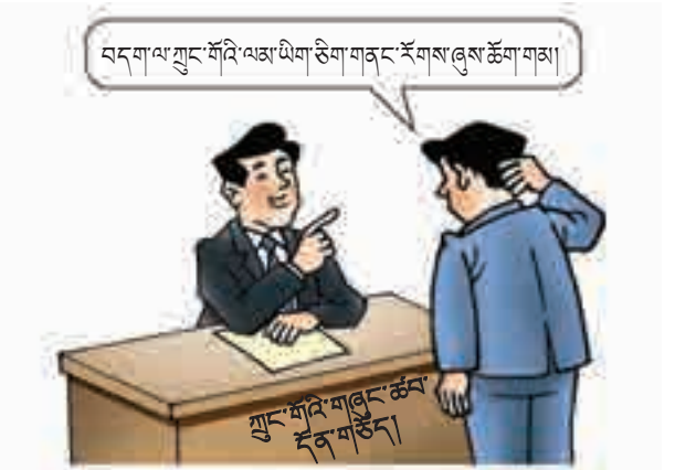
གྲུང་གོའི་ལམ་ཡིག་ཉོ་འཚོང་དང་། བཟུགས་སྤོང། རྩུན་བཟོ། རྩུར་བཟོ། རྩུང་བཅུགས་།། བསྐྱར་གཏོར་བརྒྱལ་གཏོར་བ་བཅས་བྱས་ན་དེ་ནི་ཁྲིམས་འགལ་བྱ་སྤོང་ཡིན།

ལྷ་ཉིད་ཡུལ་དེ་གའི་གནས་སྤོའི་ཡུལ་མི་ཅུང་ལ་རྒྱལ་མཚམས་ལས་།། བརྒྱལ་བའི་མཚན་བཀོད་ལག་ཁྱེར་ལྷ་བདེ་ཕྱིར། ཉིད་ཀྱིས་ཡུལ་དེ་གའི་ཉེན་ རྟོག་སྡེ་ཁག་ལ་སློན་སེང་ལྷ་དགོས། ཏུས་མཚུངས་སུ་རང་ཉིད་ཀྱི་འབྲེལ་ཡོད་ ཐོབ་ཐང་དབྱུང་ཡིག་དང་དེའི་བསྐྱར་དཔར་ཡི་གེ་དང་འབྲེལ་བར་ཁྱེར་ནས་།། ཡུལ་དེ་གར་སྤོང་པའི་གྲུང་གོའི་གཞུང་ཚབ་ཁང་དང་གཞུང་ཚབ་དོན་གཅོད་ ཁང་ཉེ་ཤོས་སུ་ལམ་ཡིག་གསལ་སྤོང་དམ་ཡང་ན་འགྲུལ་སྤོང་དཔར་ཡིག་།། སྤོང་རེ་ལྷ་བར་བསྤོང་དེ་རྒྱལ་ནང་དུ་ཕྱིར་ལོག་ཏུ་སྤོང་དགོས། ང་ཚོས་སྤོང་།། ཉིད་ལ་གསལ་འདེབས་ལྷ་རྒྱ་ཞིག་ནི། གྲུང་གོའི་ལམ་ཡིག་ཉོ་འཚོང་དང་། བཟུགས་སྤོང། རྩུན་བཟོ། རྩུར་བཟོ། རྩུང་བཅུགས་ནས་གཏོར་བརྒྱལ་གཏོར་།། བ་བཅས་བྱས་ན་དེ་ནི་ཁྲིམས་འགལ་བྱ་སྤོང་ཡིན་པས། སྤོང་འབྲེལ་ཡོད་།། མཁན་གྱིས་འབྲེལ་ཡོད་བཅའ་ཁྲིམས་ཀྱི་འགན་འཁྲི་འཁུར་དགོས།