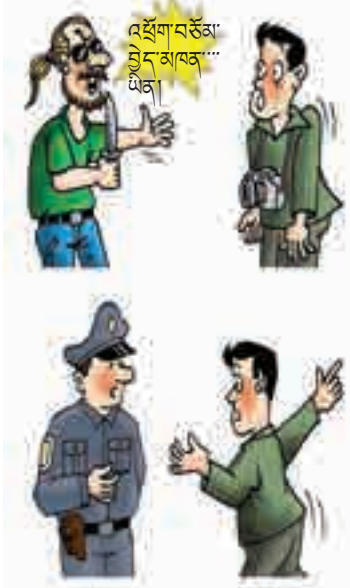
འཕྲོག་བཅོམ་ བྱེད་མཁན་ ཡིན།

འབྲུང་ས་ལ་ཉེན་རྒྱོག་སྟོན་ཆུང་ལུང་བསྐྱར་པར་ཡི་གེ་ཞིག་ཀྱང་ལེན་གནང་ དགོས། སྐྱེ་ཉིད་ཀྱིས་ད་དུང་ཁྲིམས་ཚུངས་པའམ་སྟོན་པར་(སྟོན་བཅས་བྱ་ དགོས་ཚེ་)འབྲེལ་གཏུག་གནང་དགོས་པ་དང་། ཡུལ་དེ་གར་སྤོང་པའི་ ཀྱང་ཤོའི་གཞུང་ཚབ་ཁང་དང་གཞུང་ཚབ་དོན་གཅོད་ཁང་ལ་གནས་ཚུལ་ ལྟས་ཀྱང་ཚོགས་གཞུང་ཚབ་དོན་རིགས་ཀྱིས་སྐྱེ་ཉིད་ལ་གཞུགས་ལྟར་རོགས་ རམ་བྱེད་ཐུབ་ལྟེ། མི་སྣ་འཚོམ་པོ་བཀོད་སྒྲིག་ལྟས་ནས་(པོ་མོའི་བྱུང་པར་ ཐད་ཀྱི་སྒྲིང་བྱ་ཡོད་ཚེ་)སྐྱེ་ཉིད་ལ་གནོད་འཚེ་ཐེབས་ཚུལ་ཉན་པ་དང་ འབྲེལ་སྐྱེ་ཉིད་སྐྱེ་ཉིད་ཀྱི་གསང་བ་སྒྲུང་རྒྱུའི་ཁས་ལེན་པ། ཉེན་རྒྱོག་ལས་ འབྲུང་ས་ལ་གྲོད་དོན་ཅད་གཅོད་གང་མཚོགས་བྱེད་དུ་འཇུག་པ། གྲོད་དོན་ ཅད་གཅོད་བྱེད་རིམ་ཆ་རྒྱས་ལེན་པ། སྐྱེ་ཉིད་ལ་ཁྲིམས་ཚུངས་པ་དང་སྐད་ ལྟར་པའི་མིང་ཐོ་མཁོ་འདོན། སྟོན་ཁང་འཚོམ་པོ་འོས་སྒྲིར། པོར་བརྟན་གྱི་ གམ་སྟོན་ཆག་ཤོར་བའི་འགྲུལ་སྤོང་དཔང་ཡིག་གསལ་སྤོང། སྐྱེ་ཉིད་ལ་