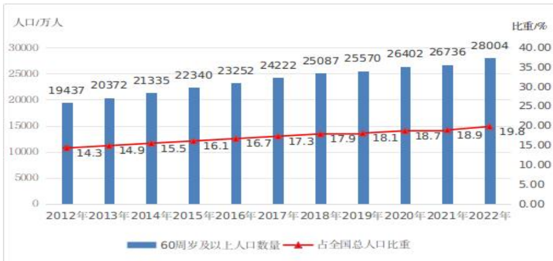
图 1 2012 年-2022 年全国 60 周岁及以上老年人口数量及占全国总人口比重

截至 2022 年末，全国 60 周岁及以上老年人口 28004 万人，占总人口的 19.8%；全国 65 周岁及以上老年人口 20978 万人，占总人口的 14.9%。全国 65 周岁及以上老年人口抚养比 21.8%。