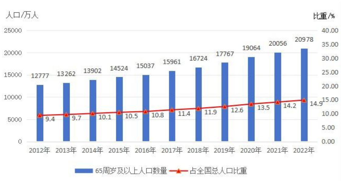
图 2 2012 年-2022 年全国 65 周岁及以上老年人口数量及占全国总人口比重