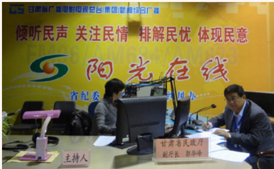
图3：“阳光在线”热线答疑