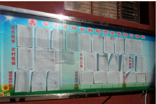
图4：社会救助资金发放公示栏

县以下通过公示栏（见图4）及发放宣传册、明白卡等形式，面向群众“广宣传”，让老百姓知晓“啥条件能享受救助”、“到哪申请低保”、“办特困供养有哪些手续”、“有问题上哪儿举报”等。