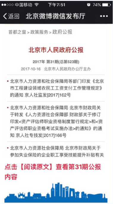
北京微博微信发布厅推送