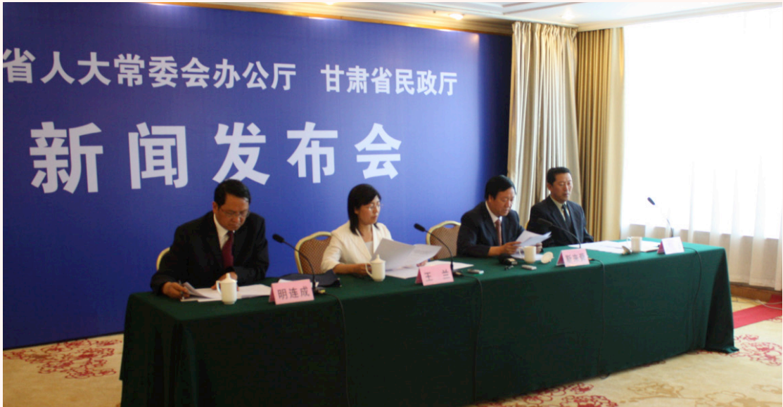
图2：新闻发布会解读政策

政策出台后，通过电视、广播等媒体，以新闻发布会（见图2）、广播专题（见图3）等形式“深解读”。