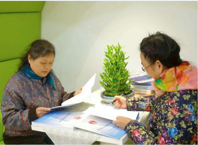
百姓查看最新公报