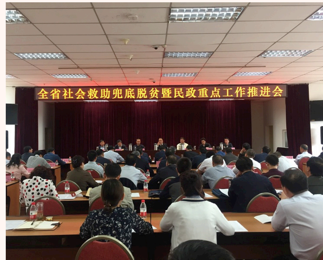
图8：社会救助工作推进会