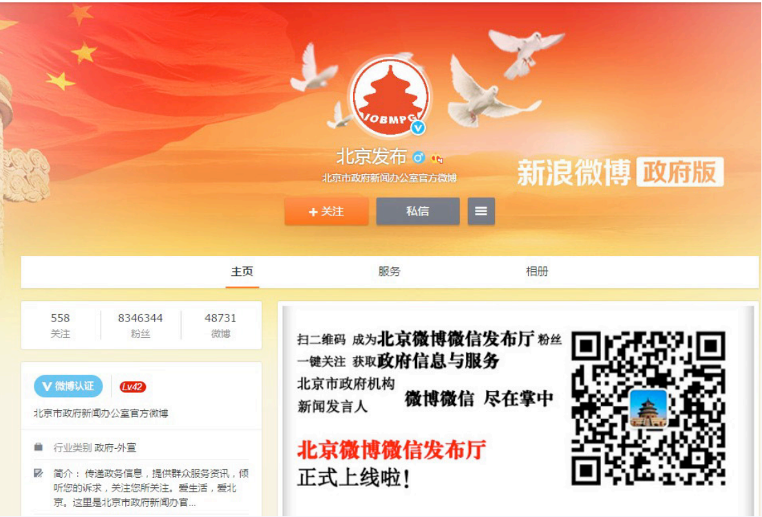
北京发布粉丝传播